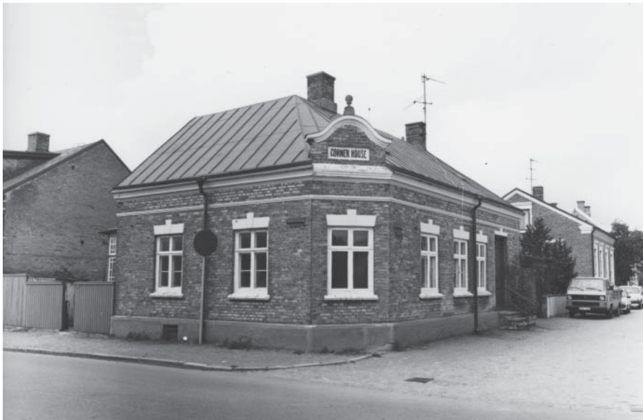
Corner House byggdes 1887, men fick ändrat utseende när Lübecksgatan anlades.