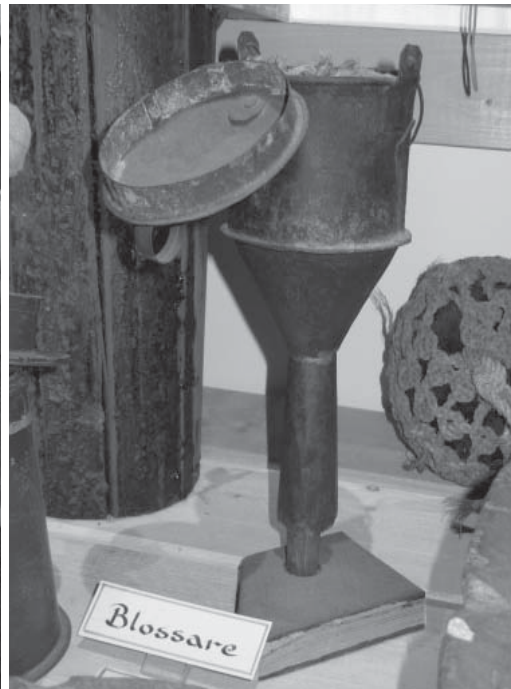
“Blossaren” varnade nalkande båtar.