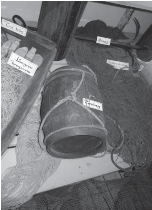
“Tosingen” höll garnen på plats.

På båten fäste man garnens slutända, ”hällemånsen.” Man kunde använda flöten i drivgarnens övre del så att de höll sig uppräta. OM fartyg eller andra båtar närmade sig och man var rädd att de skulle hamna i garnen ”bläste” man. Det innebar att man dränkte in en trasselsudd med fo-