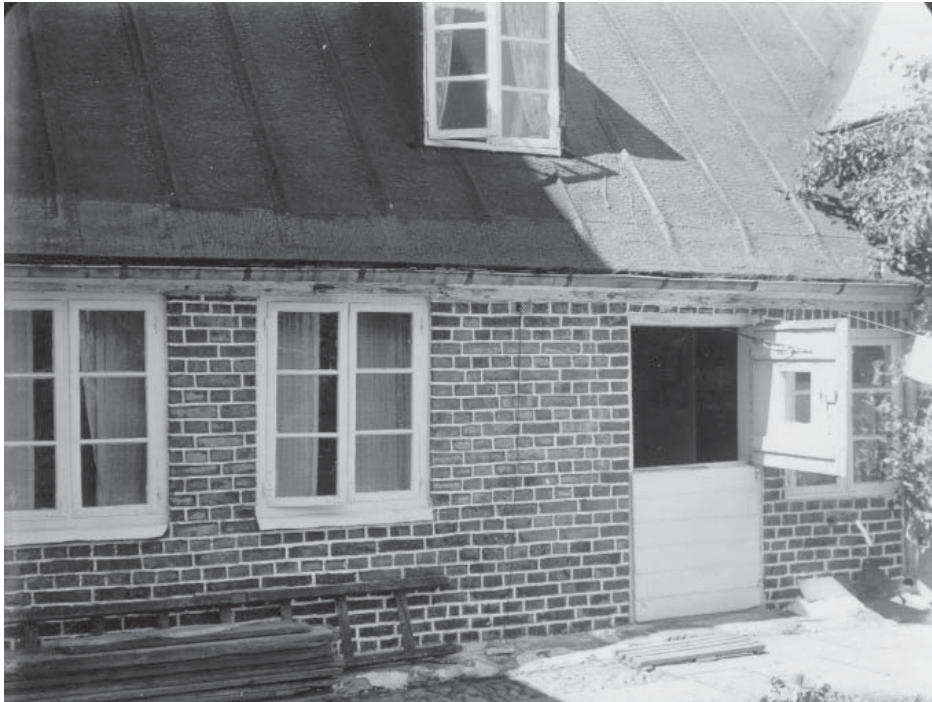
Gården till Långgatan 36, med halvdörren till köket.