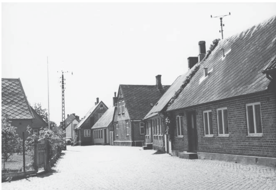
Bild från Långgatan mot Missionsgatan.