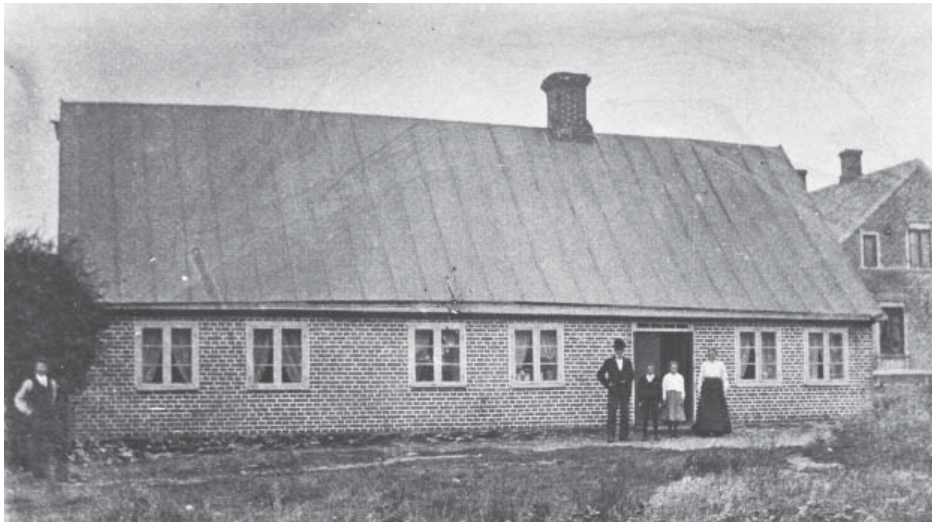
Långgatan 39 B var omgivet av odlingsmark då det byggdes på 1830-talet.

oceanhamn och Anna av Råå blev den båt som inledde den reguljära trafiken mellan Europa och denna amerikanska världstad. Båten hälsades med musik och flaggor och till kapten Alf överlämnades en guldklocka.